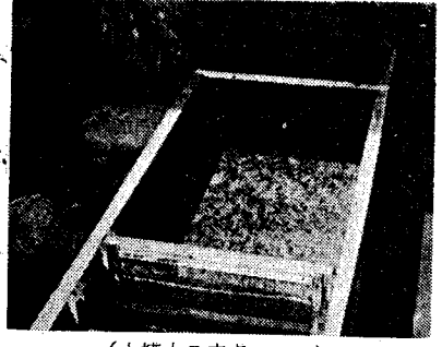
(水槽中の赤点アマゴ)