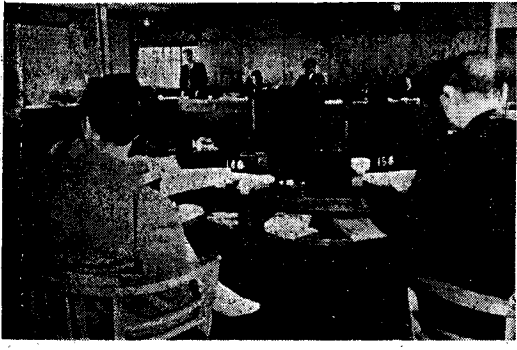
(写真はなごやかな交換風景)

する条例の制定について 日程第十五、一時借入金金について(特別会計) 日程第十六、一時借入金金について(一般会計) 日程第十七、昭和三十三年度事務報告