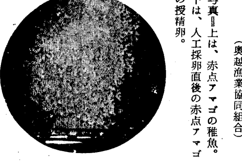
写真上は、赤点アマゴの稚魚。下は、人工採卵後の赤点アマゴの授精卵。

四月中旬頃には孵化することでしょう。尚ニジマスの二年魚(三寸から五寸)約三、〇〇〇尾と、赤点アマゴの二年魚一〇〇尾とを混合飼育中であり、之は赤点アマゴの人工養成採卵の可能不可能を試験する為であります。以上が孵化場の大要であります。 思うに第一年は僅か乍ら成功し第三年も此の分なら先ず大丈夫であります。今年こそ養産して初期の目的を達成する決心であります。今や海洋漁業さえ省約される現今、中央でも内水面に力を入れ出したように聞かれます。味覚、栄養共にアユ以上に立証されるこの赤点アマゴの養産こそ、我々の資本を投じ養魚場設置の唯一の欠くことのない農業資源ともなる訳であります。 (奥越漁業協同組合)