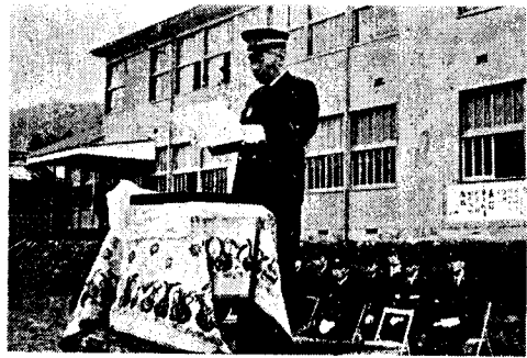
(写真説明)右は表彰状を授与する消防長。左上は放水試験。左下は勢揃いした消防団員。