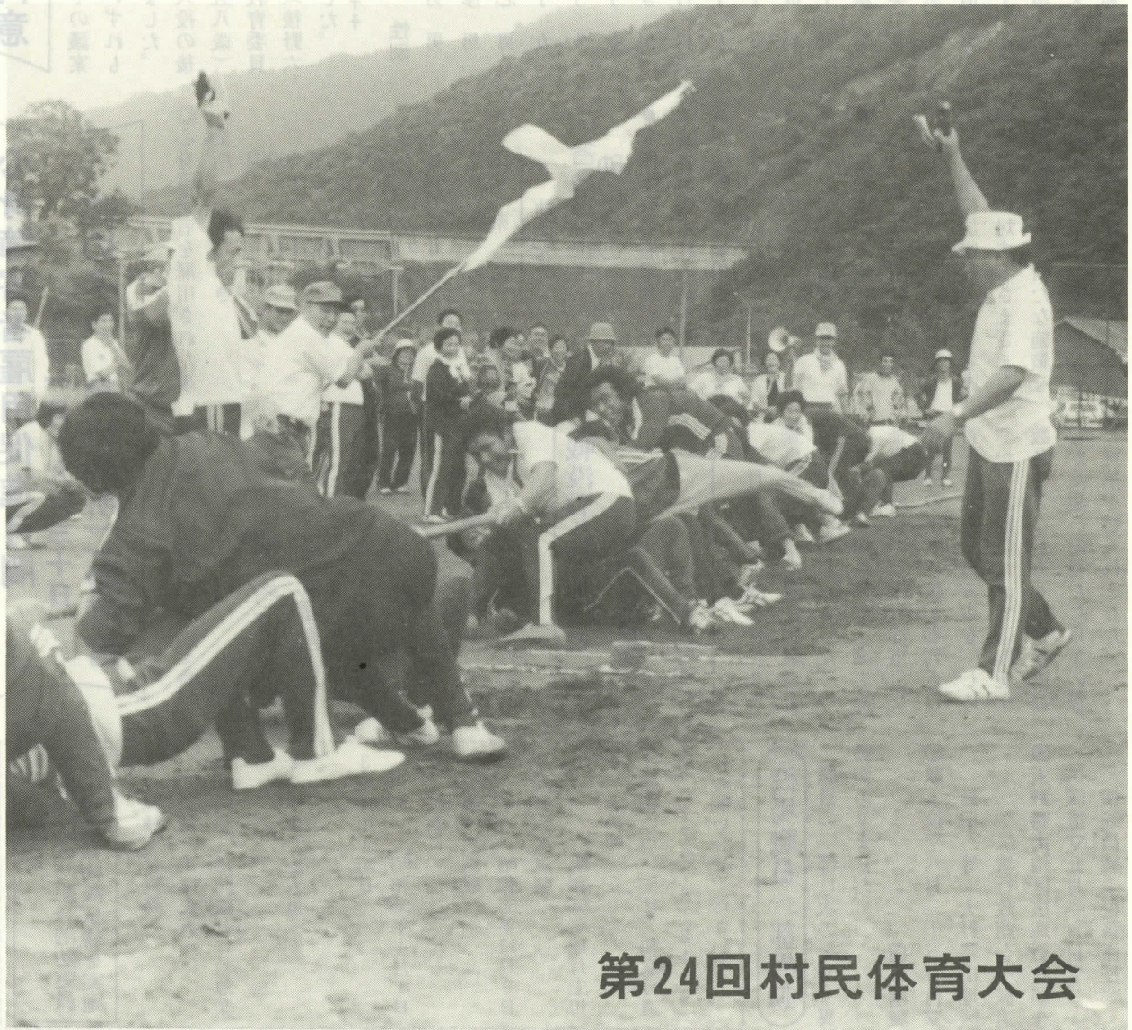
第24回村民体育大会