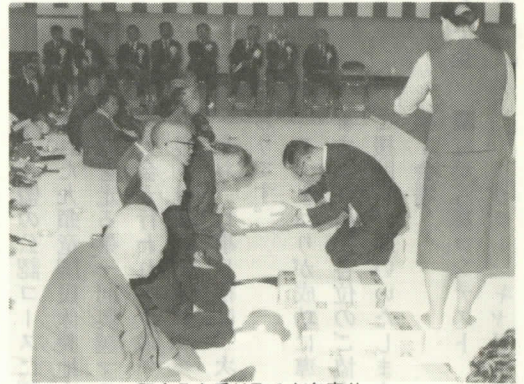
記念品を受け取るお年寄り

第七回心のふる里大会が、九月十五日大納地区村民体育館で村内各団体の協力を得て開催されました。 この日、村内のお年寄り、老人クラブ、母子福祉会、遺族会など二百数名が招かれ、八十歳以上の高齢者に村から記念品が贈られました。 午後からは、子供みこし、少年昇竜太鼓、踊りなどが披露され、楽しい意義あるふる里大会が行われました。