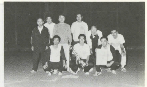
優勝した朝日Bチーム