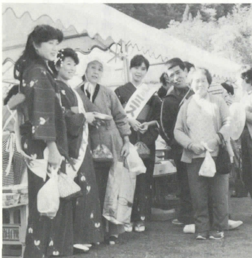
ミス紅葉と記念写真