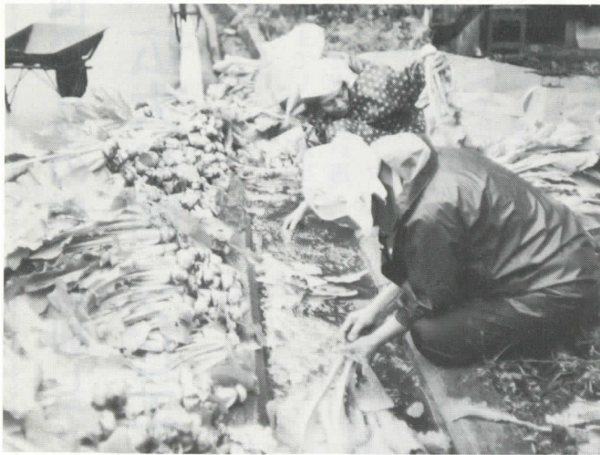
出荷の準備をする後野婦人グループ

十トンを生協やスーパーなどに、随時出荷する予定であります。このカブラは、昨年より高冷地野菜を特産にと村林産物生産促進組合が中心となって各地区やグループで生産。カブラの特徴は、カブはもとより葉が非常にやわらかく、全部が食べられる品質をもっています。