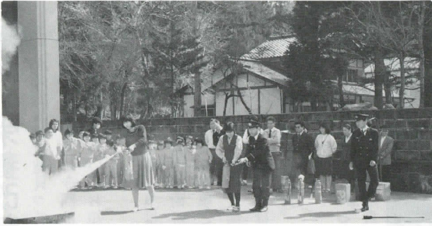
児童や先生らが消防訓練に参加しました