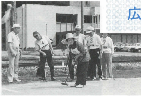
第一ゲート通ったカナ？ 村民ゲートボール大会の一コマ

スライド・テープにより生々しい実例をまじえて熱っぽく訴えられる先生のお話に補導委員一同シーンと静まり返りました。