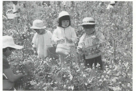
保育園児いちご狩り

和泉村特産物生産組合の試験場(板倉地係)において、六月十五日、朝日・大納両保育所の園児によるいちご狩りが行われました。