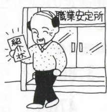
高齢者雇用促進月間

事業主の皆様方に六十歳台前半層の高齢者の雇用を積極的に進めていただくための助成制度があります。 そのなかで、当協会が取扱っている給付金の説明会を開催いたしますので、ご案内します。