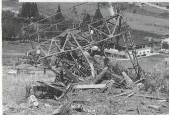
流出した第三リフトのりば