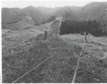
崩壊した第三ゲレンデ