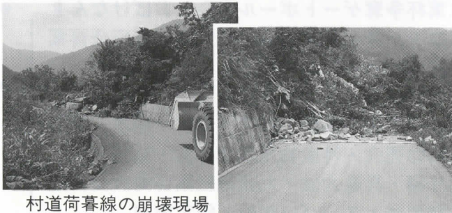
村道荷暮線の崩壊現場